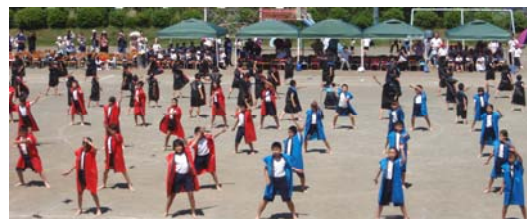
3・4年 「MUKAIDA 爽涼鼓舞」