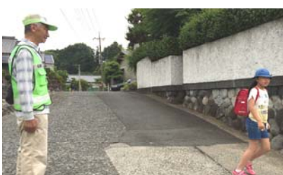
<安全を見守ってくださっている方々>

自分以外の人のために、自分が使える時間「いのち」を使うことで向田小学校みなさんの「いのち」を輝かせましょう！