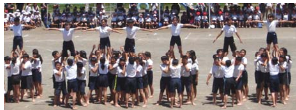
5・6年 「希望～40th Anniversary～」