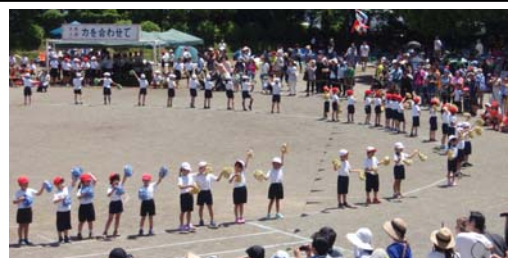
1・2年 「かわいい! 向田恋ダンス」

保護者の皆様、地域の皆様には温かなご声援と、種目への参加や安全面や片づけでのご協力をいただき、ありがとうございました。