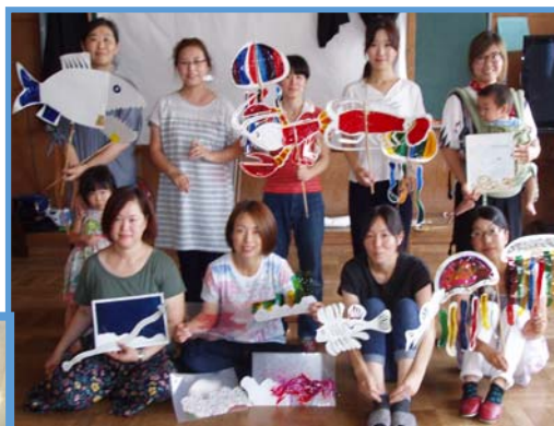
7月10日(月)練習の様子