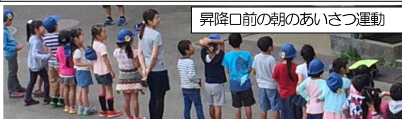
昇降口前の朝のあいさつ運動

元気に明るい「おはようございます」は、安全を見守ってくださっている地域の方々への感謝の気持ちも伝えてくれます。